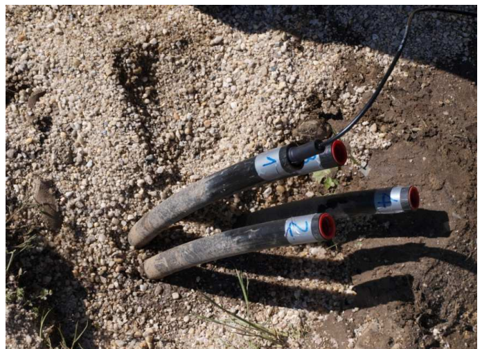
Befahren der Sondenrohre zur Messung der Bohrlochverfüllung