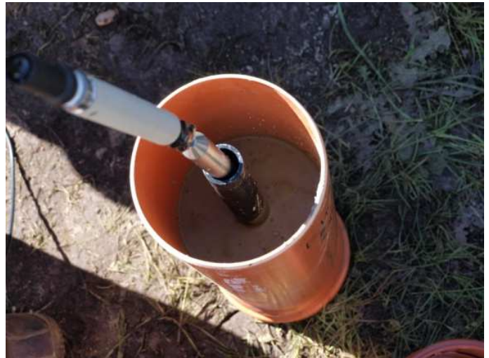
Messung an einem Probekörper

Markierte Füllbinder® sind mit verschiedenen Wärmeleitfähigkeiten erhältlich, weisen eine sehr geringe Wasserdurchlässigkeit, einen hohen Sulfatwiderstand auf und sind widerstandsfähig bei Frost-Tau-Wechselbelastungen.