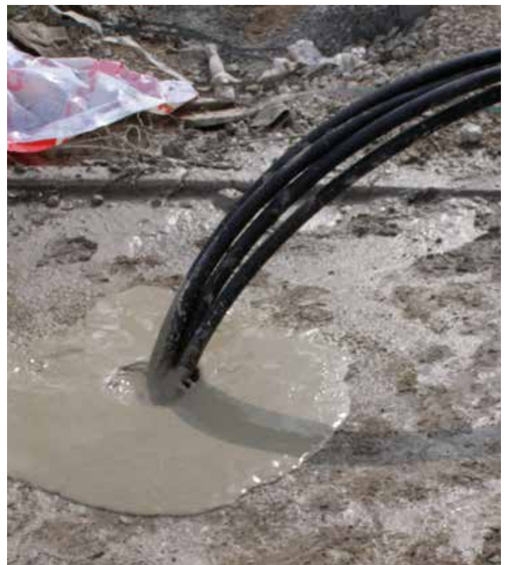
Mit Füllbinder® EWM verfülltes Bohrloch