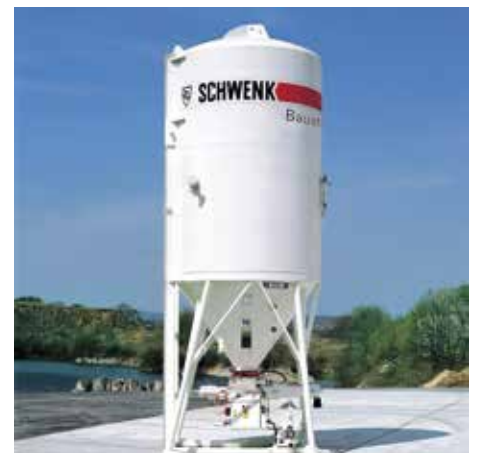
Baustellensilo mit Silomischpumpe »quadro-mat«

Bitte beachten Sie unser technisches Merkblatt Füllbinder® EWM unter www.schwenk.de