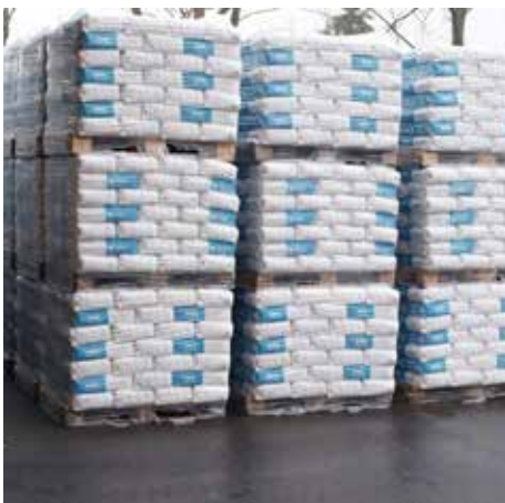
Füllbinder® EWM als Sackware

In Säcken mit 25 kg Inhalt, als lose Ware im Silozug oder im Baustellensilo mit Silomischpumpe SCHWENK »quadro-mat«.