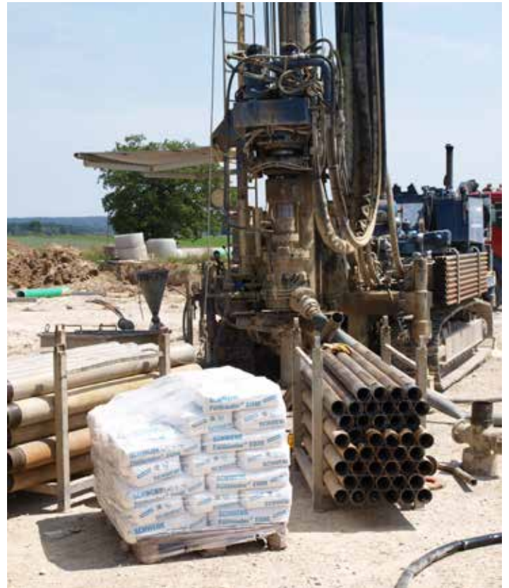
Bohrung einer Erdwärmesonde

Füllbinder® EWM erfüllt die hygienischen Anforderungen an zementgebundene Werkstoffe im Trinkwasserbereich gemäß DVGW Arbeitsblatt W 347. Daher kann er aus grundwasserhygienischer Sicht im Trinkwasserbereich und entsprechenden Schutzzonen eingesetzt werden.