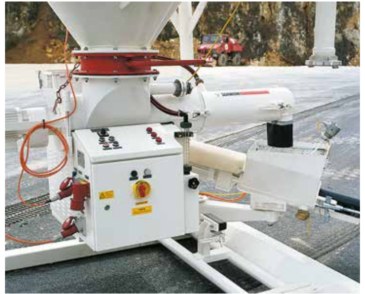
Anmischen lose Ware mit Silomischpumpe »quadro-mat«