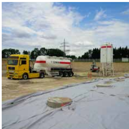
Lieferung von Füllbinder® EWM im Silozug