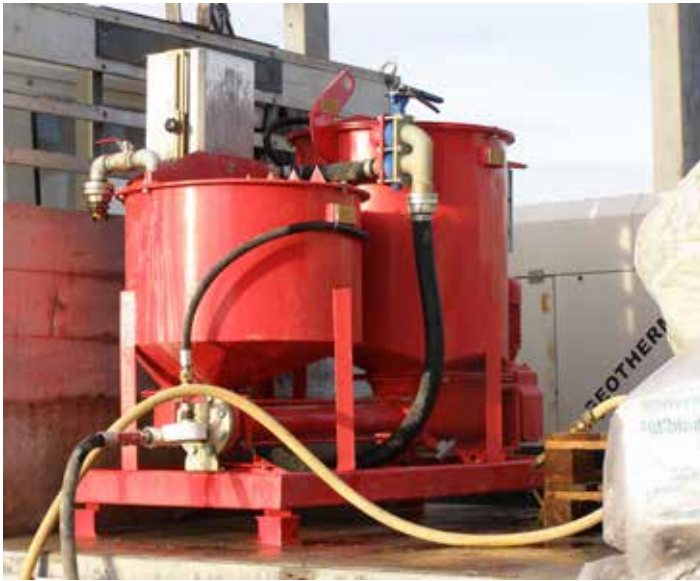
Anmischen Sackware im Chargenmischer

Füllbinder® EWM kann in branchenüblichen Mischern unter Zugabe von Wasser angemischt werden. Eine ausreichende Mischzeit und Mischintensität ist einzuhalten. Die Suspension ist knollenfrei und homogen anzumischen und einzubauen.